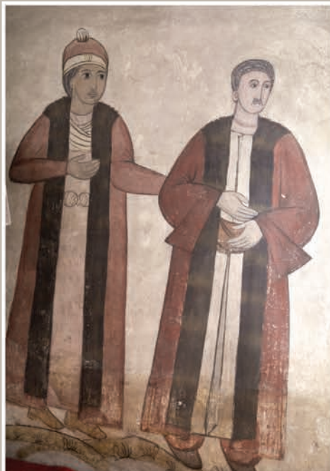
Detalii pictură interioară