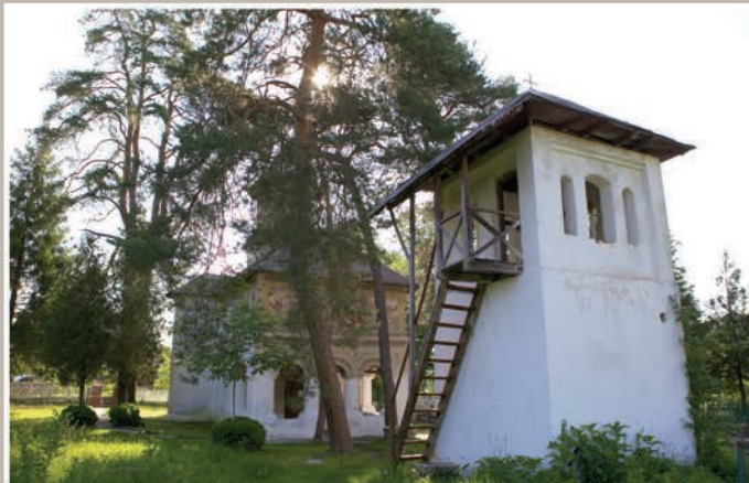
Vedere ansamblu Nord-Vest