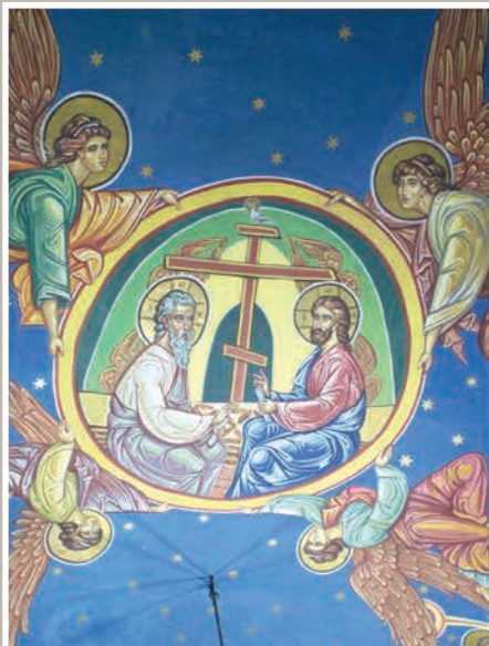
Detalii Pictură Boltă