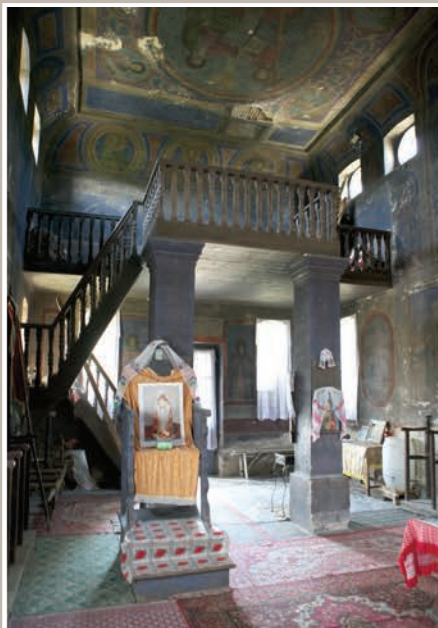
Interior spre Pronaos