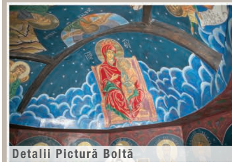
Detalii Pictură Boltă