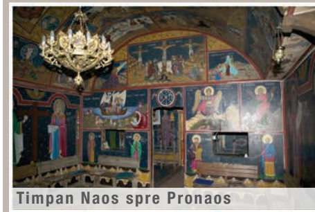
Timpan Naos spre Pronaos