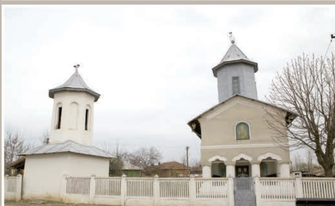
Vedere din drum de acces

An construcție sau atestare istorică: Datare, 1821 – conform LMI 2010