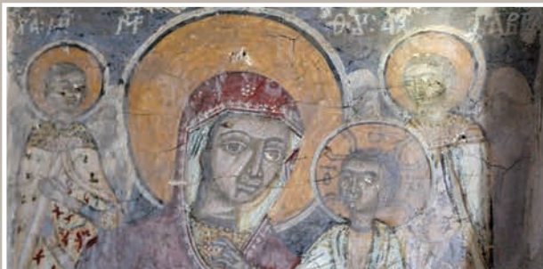
Detalii Pictură-Maica Domnului cu Pruncul