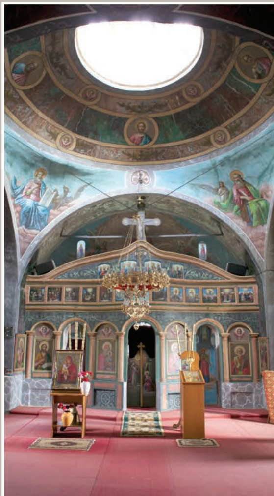
Naos-Vedere spre Altar