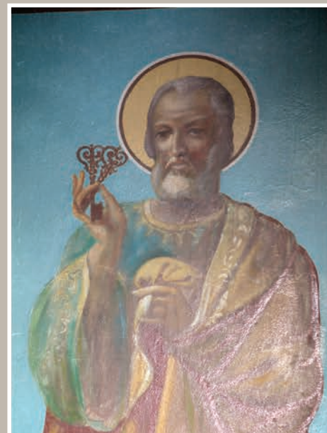
Altar-Detaliu Sfântul Petre-Perete Sud

An construcție sau atestare istorică: Datare, începutul secolului al XIX-lea – conform LMI 2010