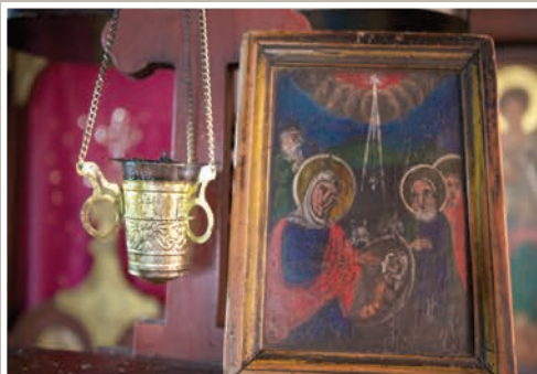
Icoană de lemn