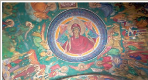
Boltă Pronaos-Maica Domnului