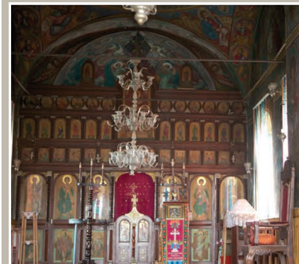
Catapeteasmă de lemn