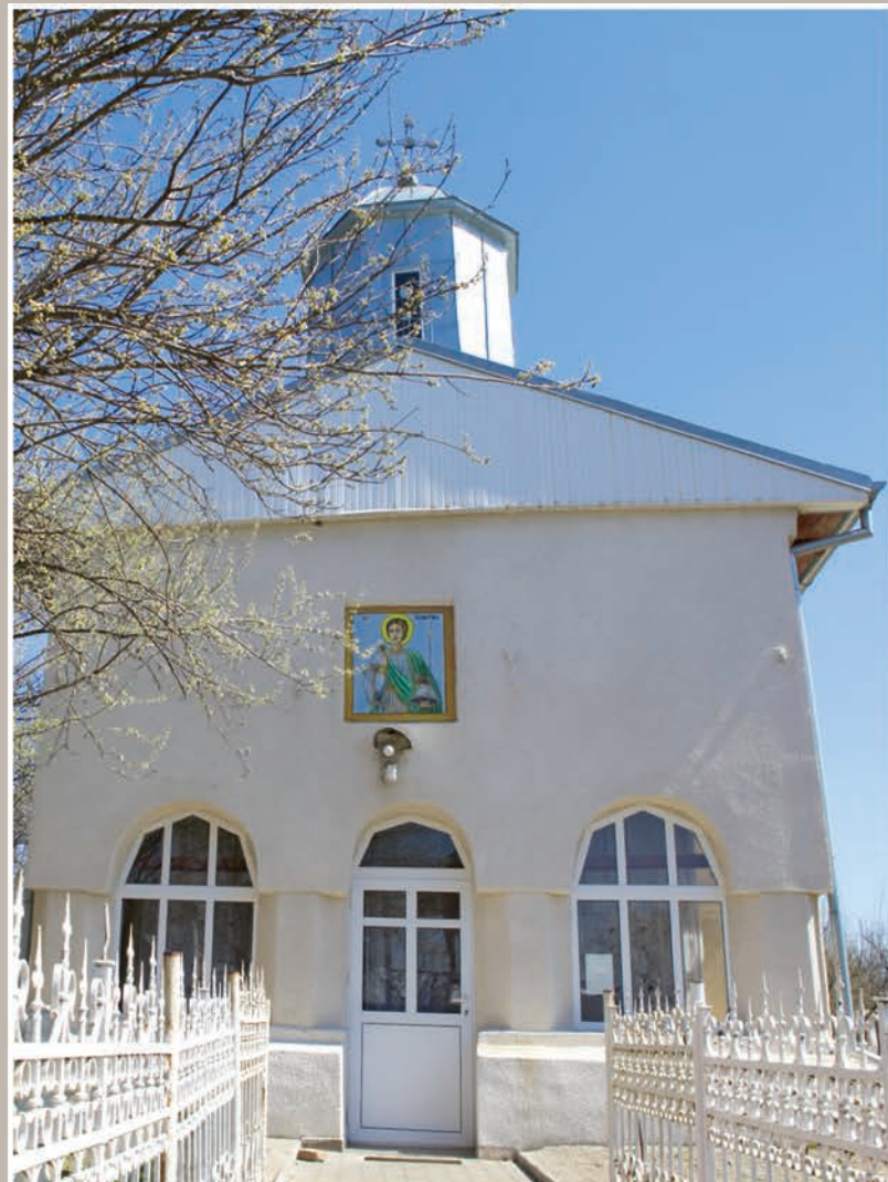
Fațadă Vest-Pridvor Închis

An construcție sau atestare istorică: Datare, 1781-1823, cu adăugiri în 1831 – conform LMI 2010