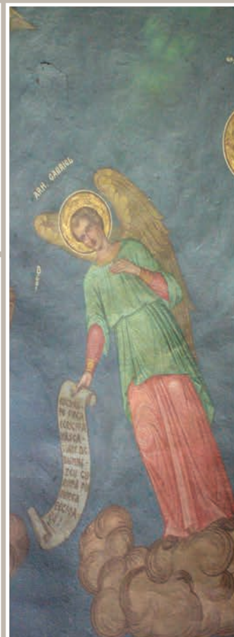
Detalii Pictură Boltă