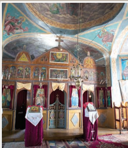
Catapeteasmă de zid