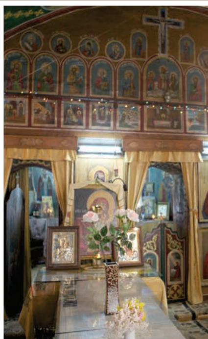
Timpan Catapeteasmă spre Altar