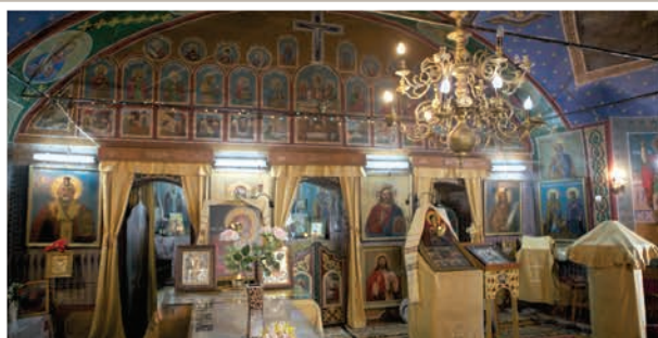
Catapeteasmă de zid