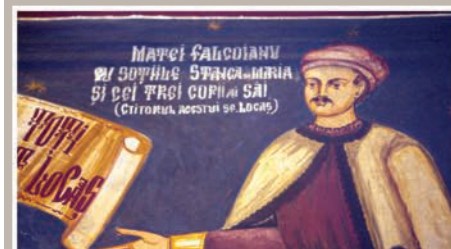
Detaliu Tablou Votiv