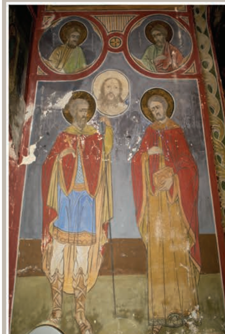
Detalii Pictură, spalet Vest