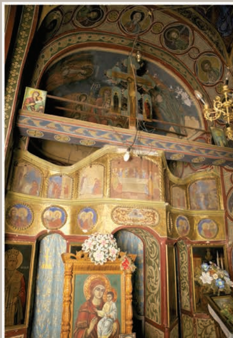
Catapeteasmă de zid