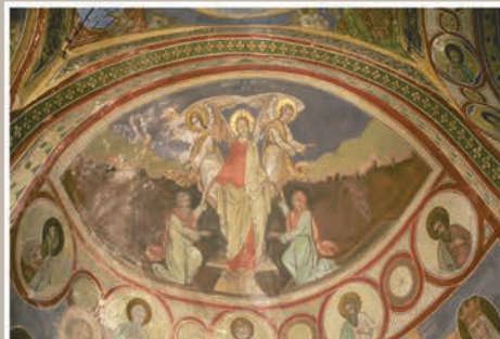
Detalii Boltă Absidă Nord