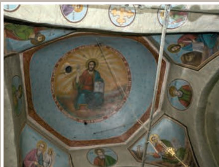
Detalii Pictură Boltă