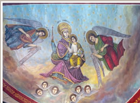
Detalii Pictură Boltă