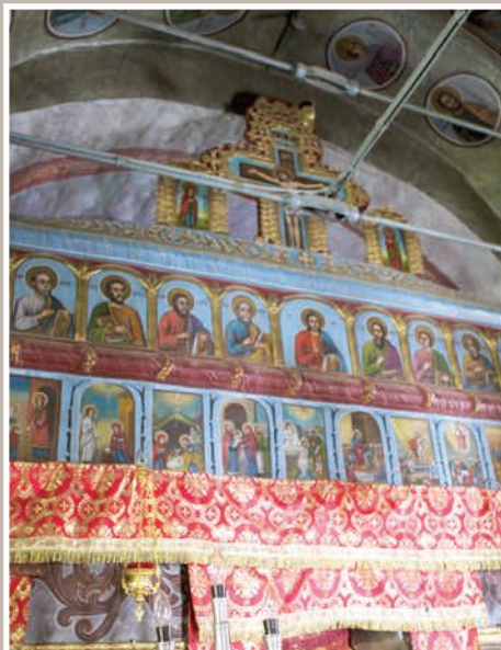
Detalii Catapeteasmă-registru superior