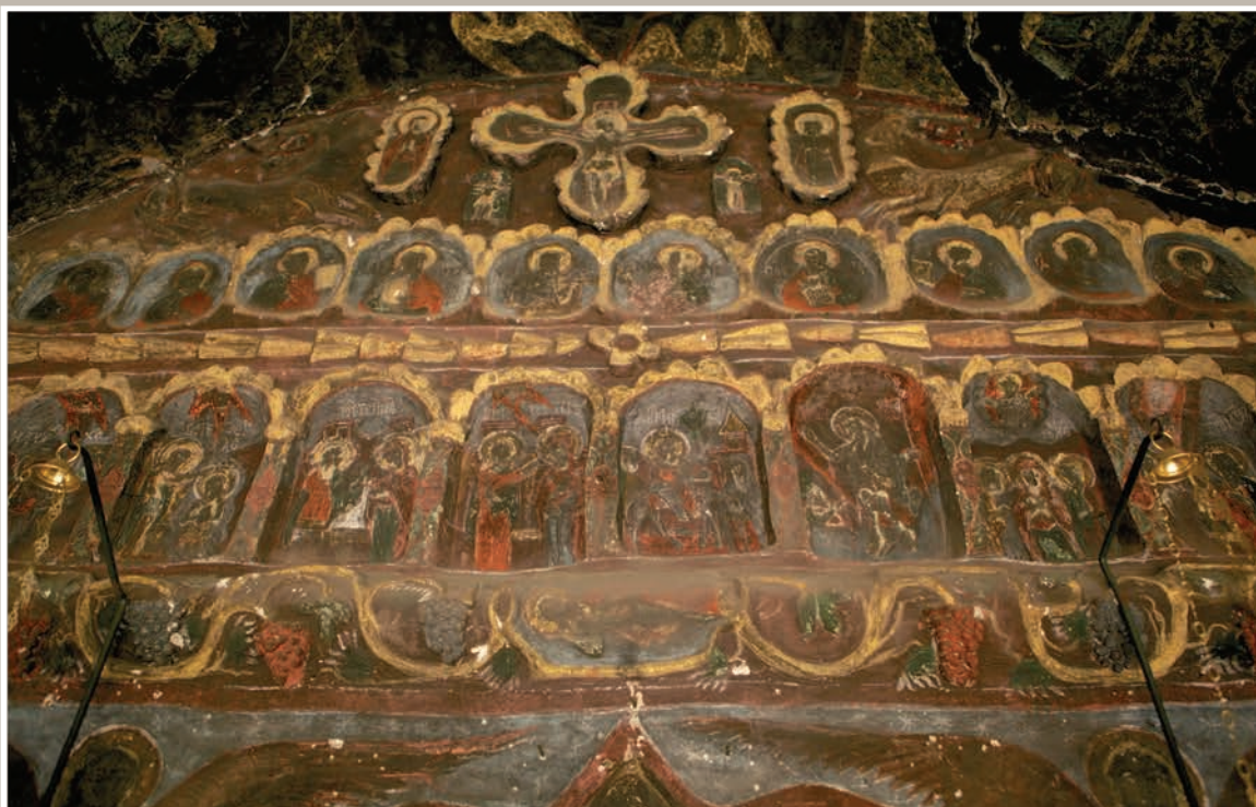
Detalii Catapeteasmă-registru superior