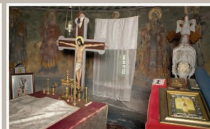
Altar-detaliu perete Nord-Est