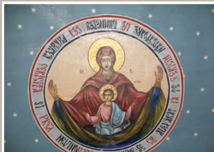
Boltă Pronaos-Maica Domnului