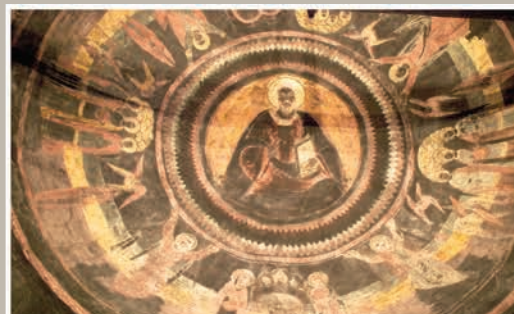
Detalii Boltă Pantocrator