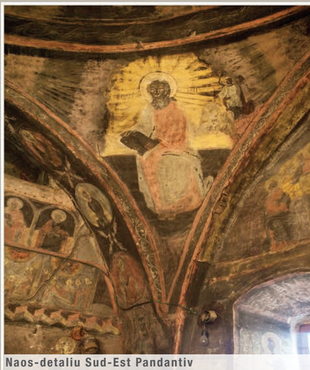
Naos-detaliu Sud-Est Pandantiv