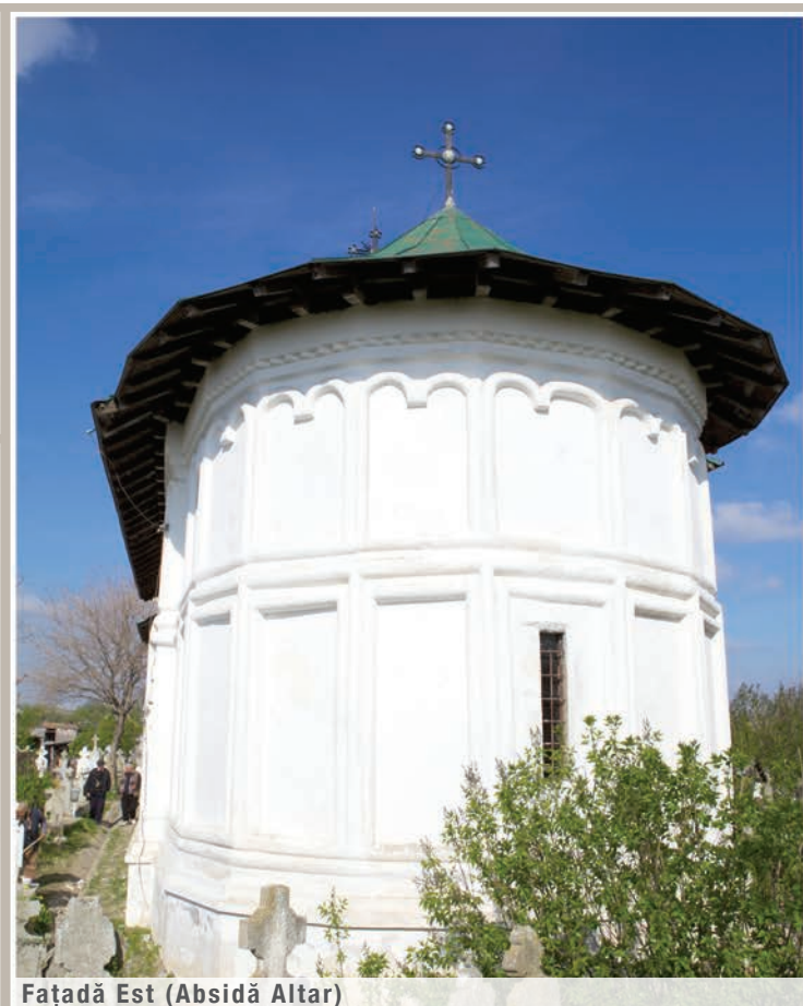
Façadă Est (Absidă Altar)

Ctitori: Matei Basarab și Doamna Sa Elina