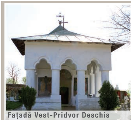
Façadă Vest-Pridvor Deschis