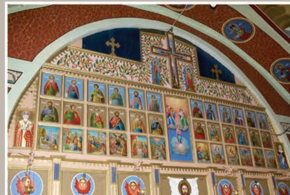
Detalii Catapeteasmă de lemn