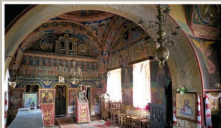
Naos spre Altar-Vedere din Pronaos