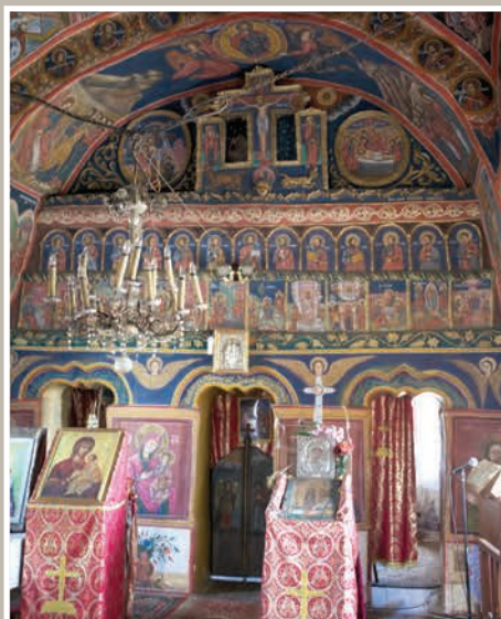
Catapeteasmă de zid