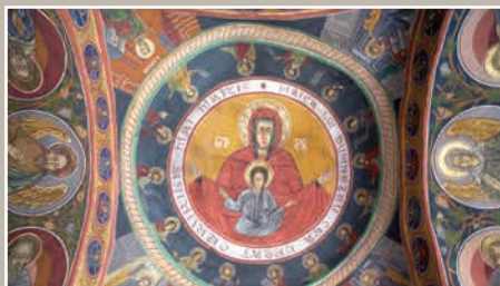
Boltă Pronaos-Maica Domnului