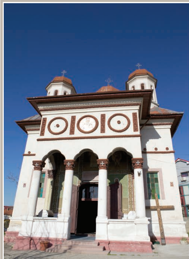
Fațadă Vest-Pridvor Deschis