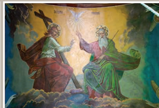
Naos-detaliu intrados arc

An construcție sau atestare istorică: Datare, 1700, ref.1889 – conform LMI 2010