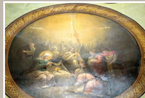
Detalii Boltă Pantocrator