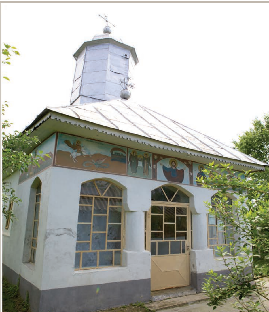
Fațadă Vest-Pridvor Închis

An construcție sau atestare istorică: Datare, 1885 – conform LMI 2010