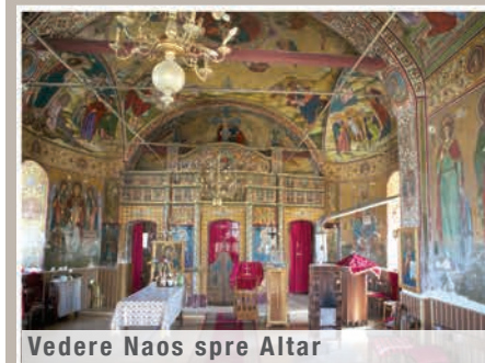
Vedere Naos spre Altar