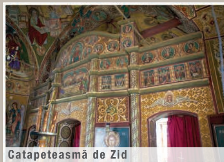
Catapeteasmă de Zid