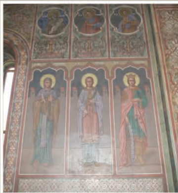
Detaliu Pictură Interioară