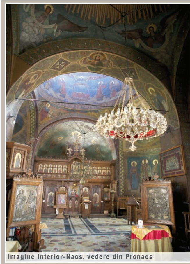
Imagine Interior-Naos, vedere din Pronaos