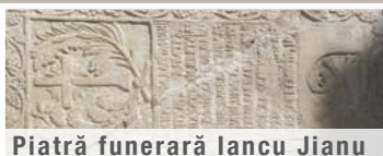
Piatră funerară Iancu Jianu