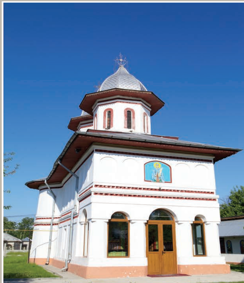
Vedere Nord-Vest – Pridvor cu Tablou Hram