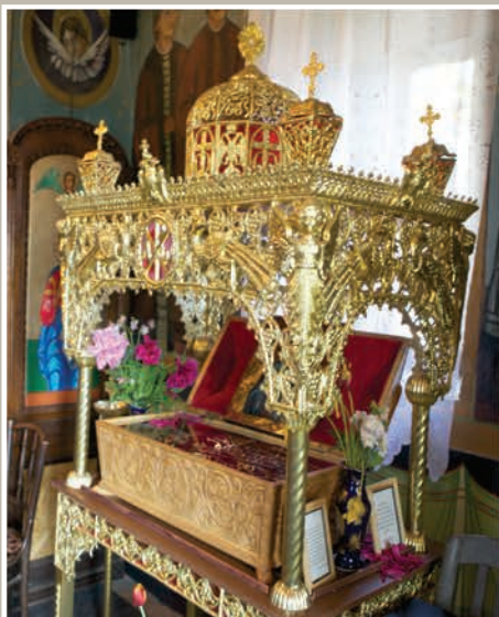
Racla Sfințelor Moaște