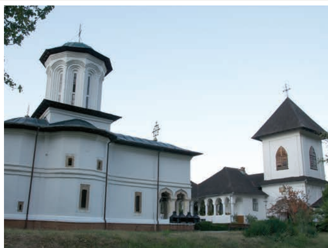
Vedere laterală a bisericii