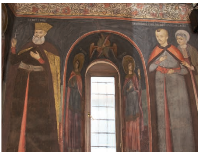
Picturi din interiorul bisericii