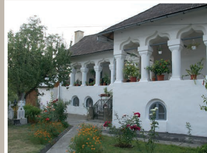
Vedere din curtea interioara a mănăstirii