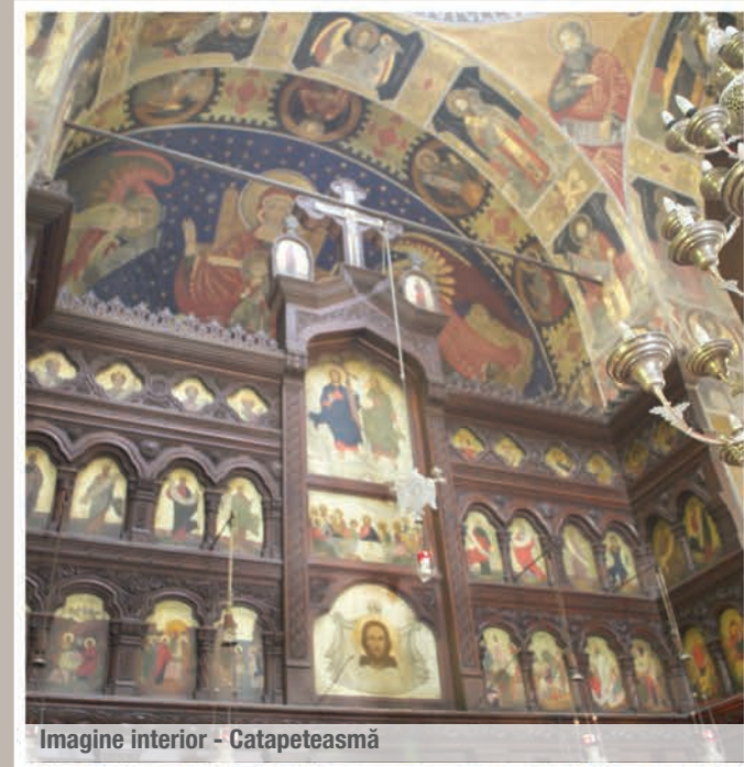
Imagine interior - Catapeteasmă

Mănăstirea Stănișoara, cu hramul „Sfântul Gheorghe“ este amplasată la poalele masivului Cozia, pe versantul său sudic, pe teritoriul localității Călimănești, județul Vâlcea.