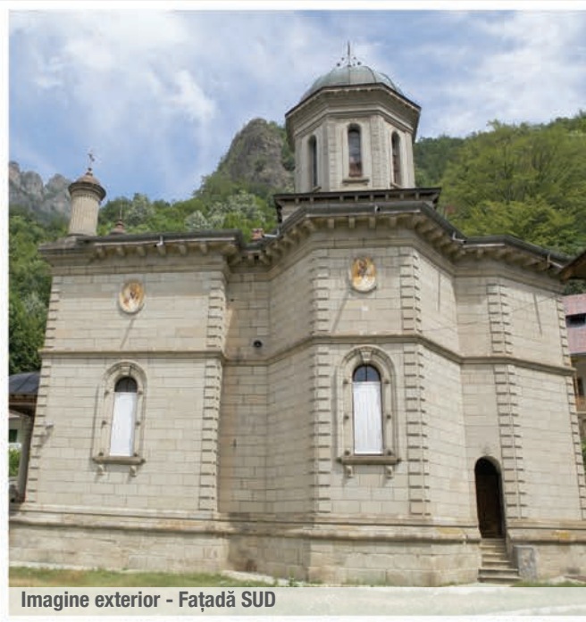
Imagine exterior - Fațadă SUD