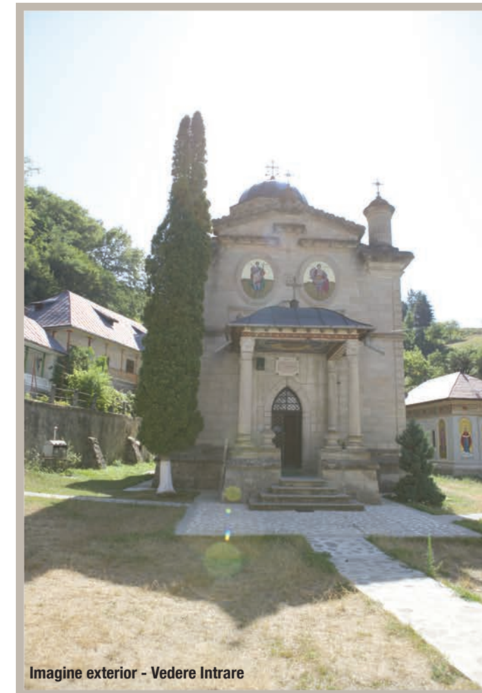
Imagine exterior - Vedere Intra

Mănăstirea Stănișoara mănăstire de maici, viață de obște monument istoric, județul Vâlcea