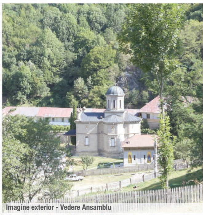
Imagine exterior - Vedere Ansamblu