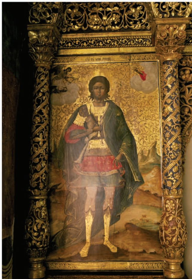
Icoană de lemn

Conținutul acestui material nu reprezintă în mod obligatoriu poziția oficială a Uniunii Europene sau a Guvernului României