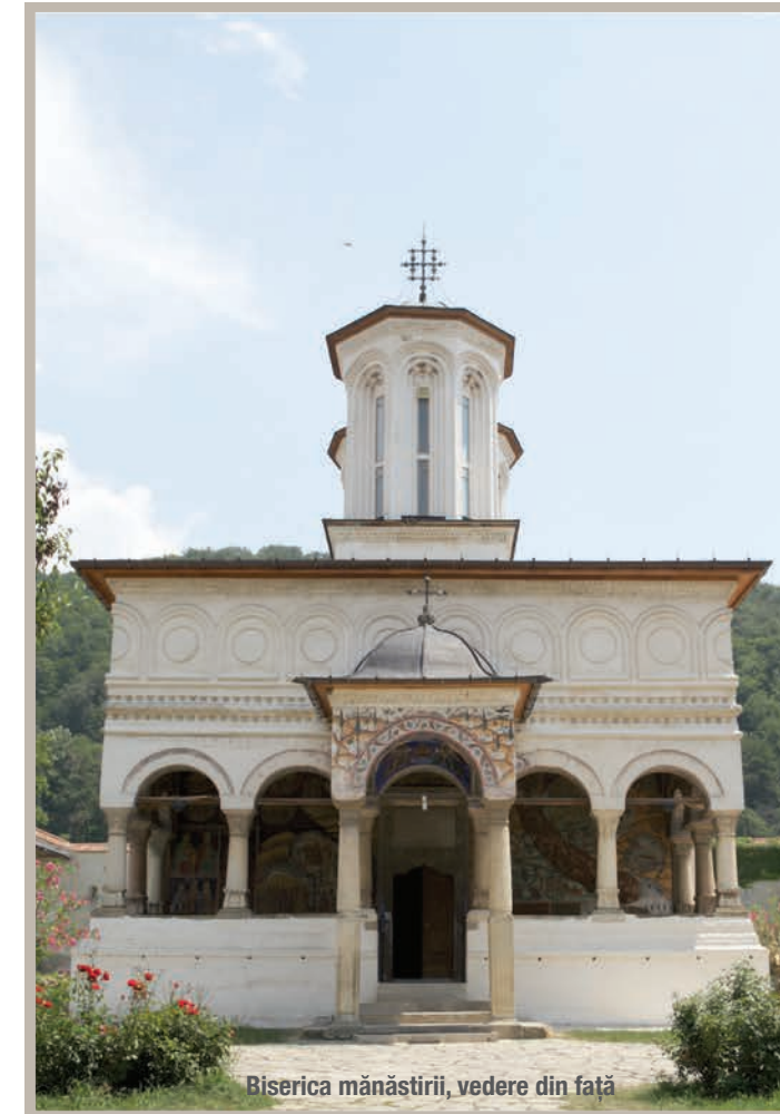
Biserica mănăstirii, vedere din față

Mănăstirea Hurezi monument istoric, județul Vâlcea mănăstire de maici, viață de obște