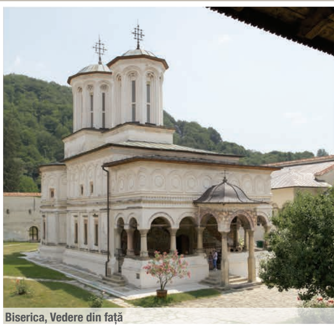
Biserica, Vedere din față