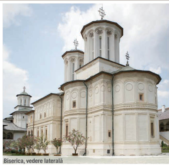
Biserica, vedere laterală