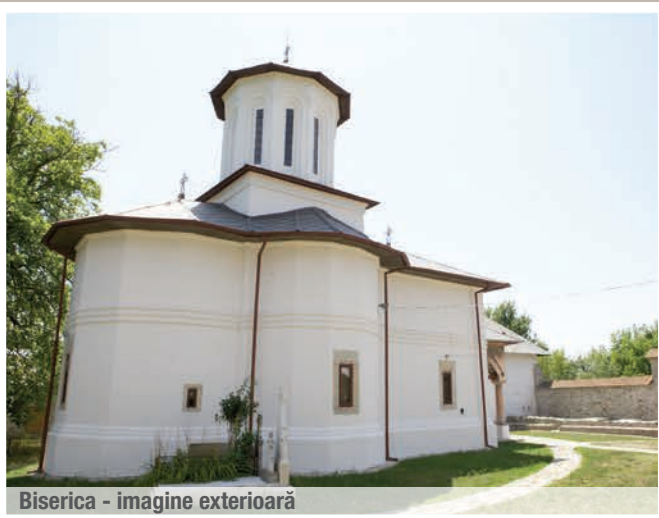
Biserica - imagine exterioară