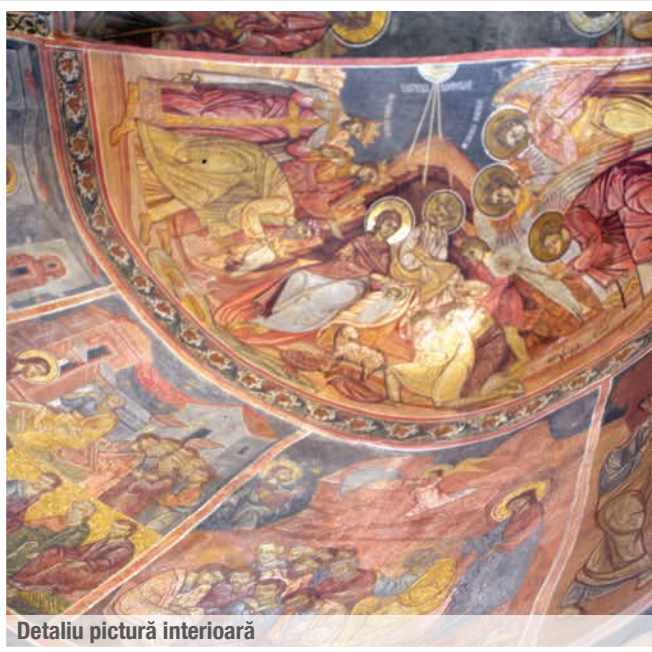
Detaliu pictură interioară