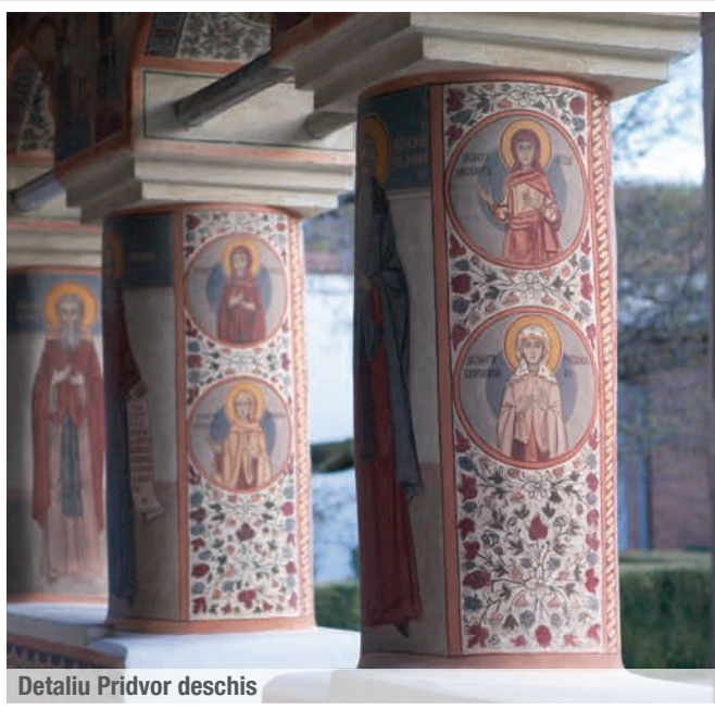
Detaliu Pridvor deschis