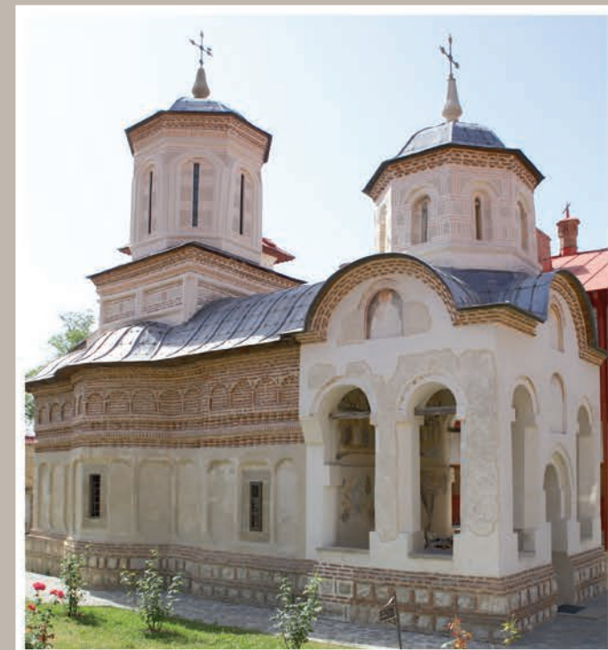
Biserica veche - vedere Nord-Vest

Mănăstirea Arnota, ce poartă hramul „Sfinții Arhangheli Mihail și Gavriil” este o mănăstire ortodoxă cu obște de maici, situată în comuna Costești, județul Vâlcea și este amplasată pe muntele cu același nume (Arnota), la altitudinea de 820 m.