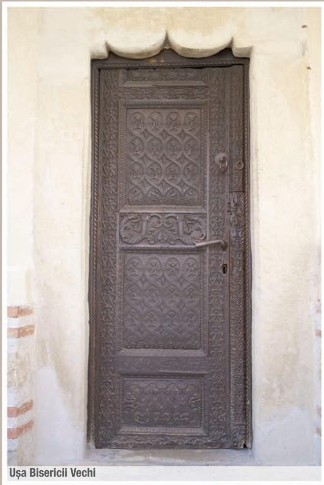
Ușa Bisericii Vechi

Ministerul Dezvoltării Regionale și Administrației Publice Autoritatea de Management pentru Programul Operațional Regional Strada Apolodor Nr. 17, sector 5, București Telefon: 0372 111 409 E-mail: info@mdrap.ro www.mdrap.ro www.info regio.ro