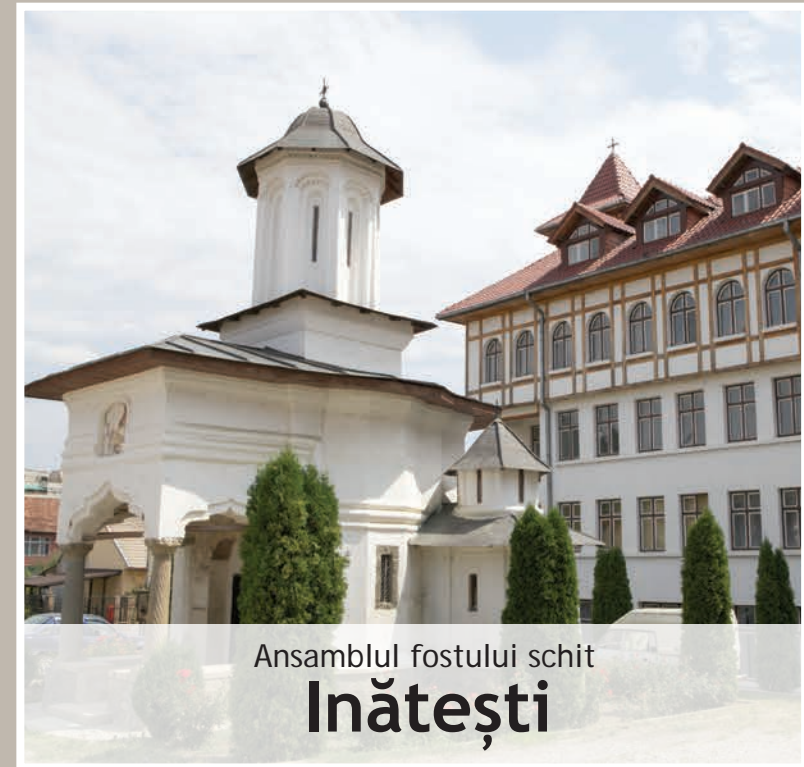
Ansamblul fostului schit Inătești