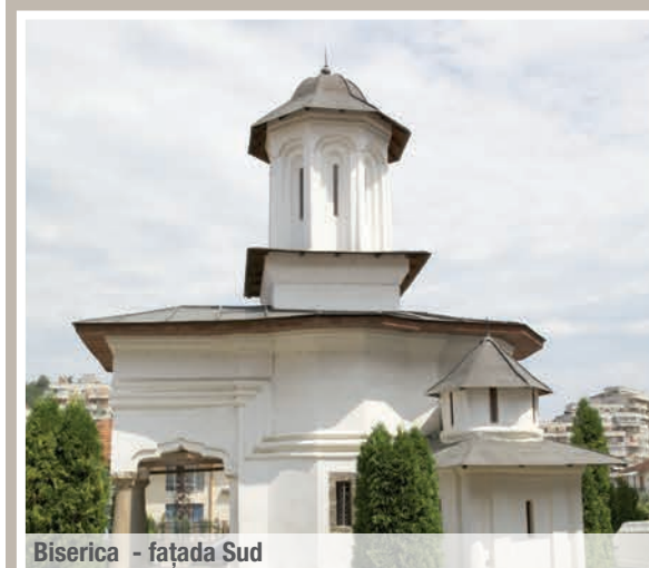
Biserica - fațada Sud